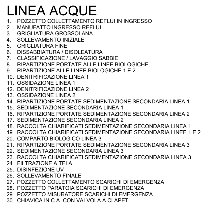
Scala 1 : 500